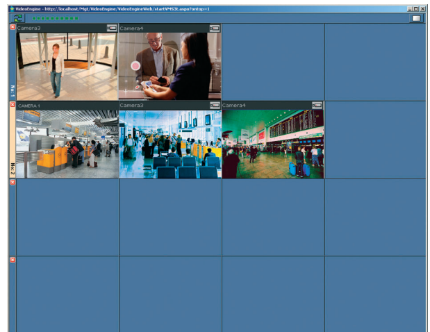
Esempio di matrice allarmi con 2 situazioni di allarme attive