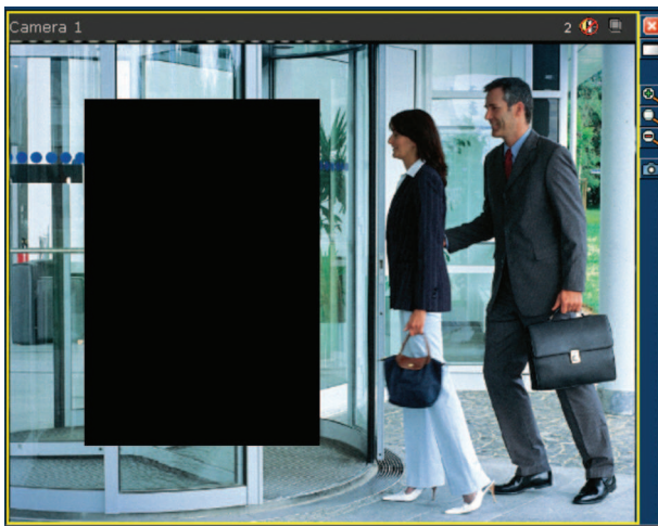
Fig. 2: Área enmascarada con la función de áreas privadas