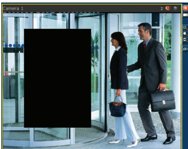
Fig. 2: Área enmascarada con la función de áreas privadas