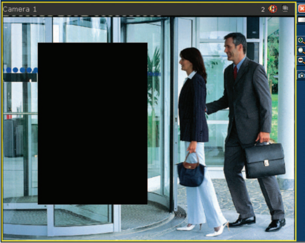
Şek. 2: Gizli Bölgeler özelliği tarafından maskelenen alan