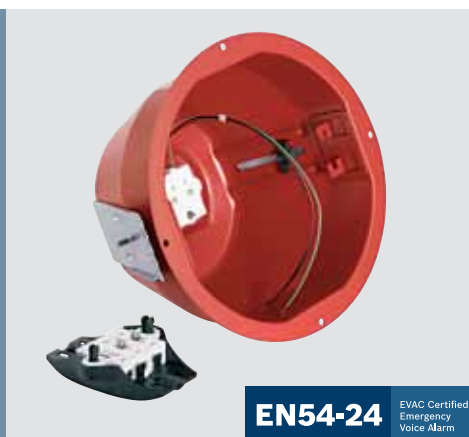
EN54-24 EVAC Certified Emergency Voice Alarm

对于有火灾隐患的应用场合，每个扬声器都可配备并轻松连接单一类型的防火罩。创新的陶瓷连接器和防火罩上的“环路”装置，允许刚性的 E30 系统电缆在连接到天花板扬声器之前进行预先布线 and 测试。这不仅减少了安装时间，同时也维护了 EVAC 标准。