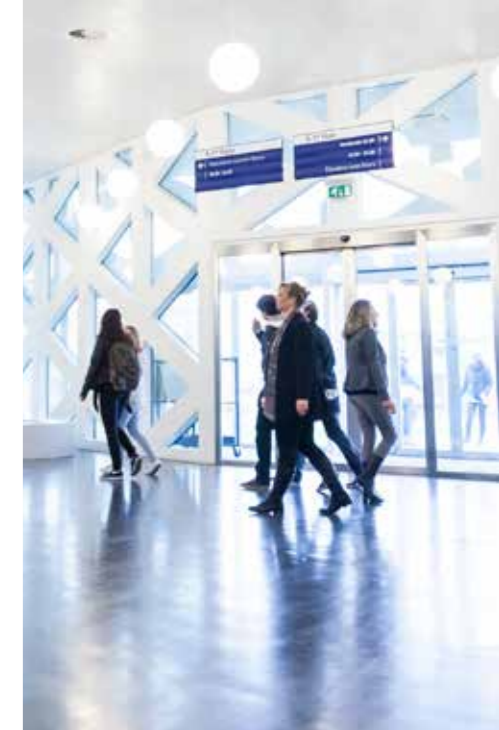
PAVIRO: Veřejné ozvučení, evakuační rozhlas a zvuk ve špičkové kvalitě