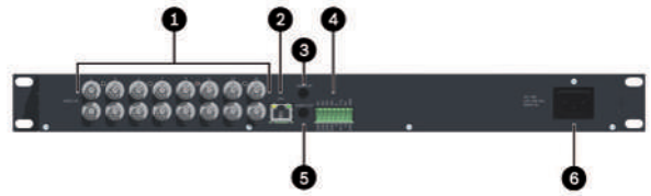
Abb. 3: VIDEOJET multi 4000 Rückseite