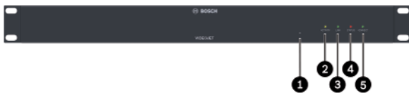
Abb. 2: VIDEOJET multi 4000 Vorderseite