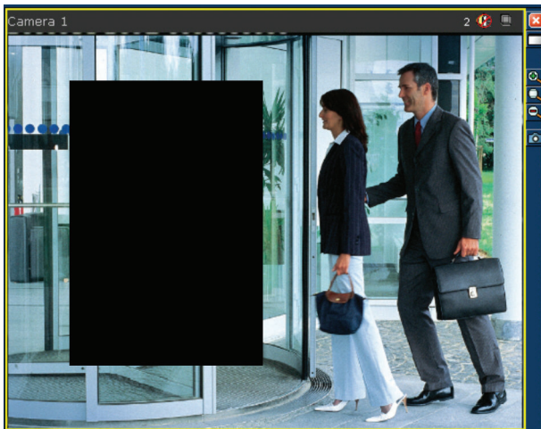
Área enmascarada con la función de áreas privadas