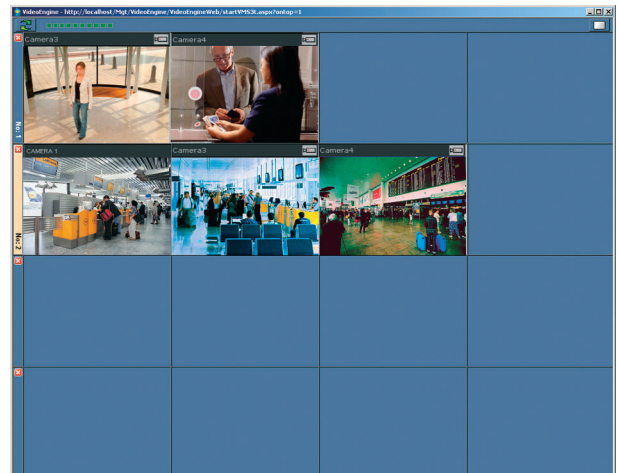
Voorbeeld van een alarmmatrix met 2 actieve alarmsituaties