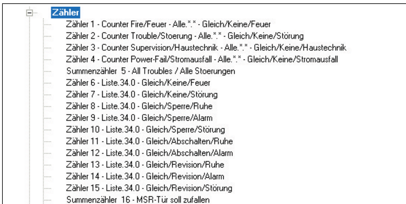
Bild 2.3 Auslösekriterien für FAA-420-MSR bzw. FSA

In den Zählern 6 bis 15 sind die Auslösekriterien für die FSA festgelegt. Diese sind im Summenzähler 16 zusammengefasst, d.h. der Summenzähler 16 muss als Bedingung für die FSA-Ansteuerung mit FAA-MSR 420 Meldersockel mit Relais verwendet werden.