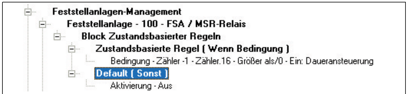
Bild 2.4 Summenzähler 16 im Feststellanlagen-Management