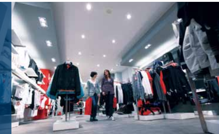
Imagem inferior: configuração LC-4 com altifalantes com amplos ângulos de abertura. São necessários menos altifalantes e a qualidade de áudio sentida é sempre consistente.

Imagem superior: configuração tradicional que utiliza altifalantes com ângulos de abertura mais reduzidos. Para proporcionar uma cobertura completa, são necessários altifalantes adicionais. Ainda assim, nas áreas com tectos baixos continuam a produzir-se flutuações na saída de áudio ao passar por baixo das mesmas.