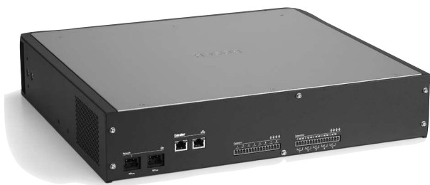
Obr. 1: Pohled zezadu